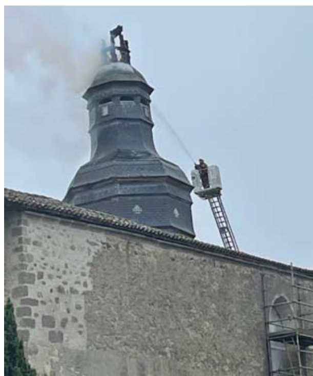
Les pompiers au plus près