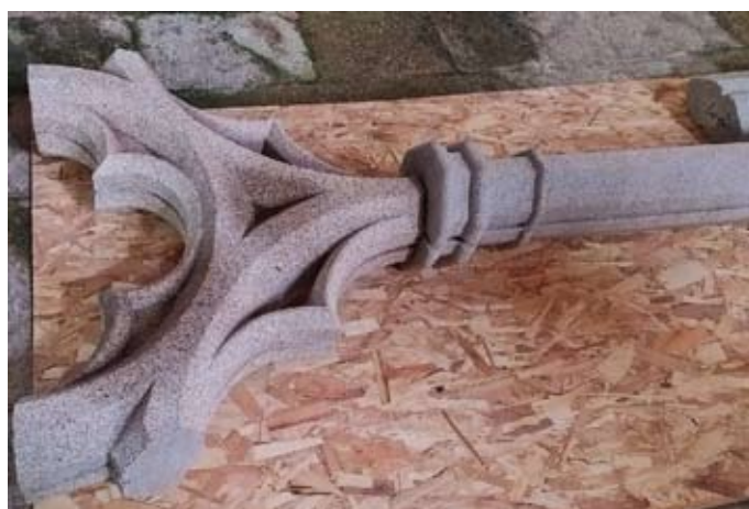
Taille d'un réseau neuf (30 juin 2022)