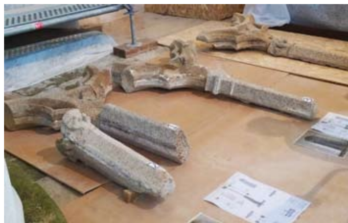
Réseaux à remplacer