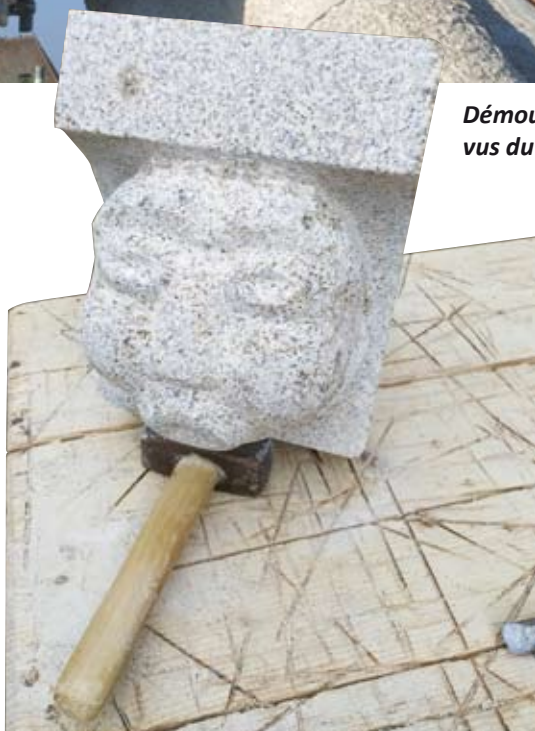
Taille d'un modillon (2 avril 2022)