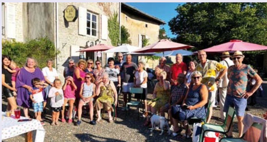
Verre de l'amitié avant le départ pour l'Ukraine