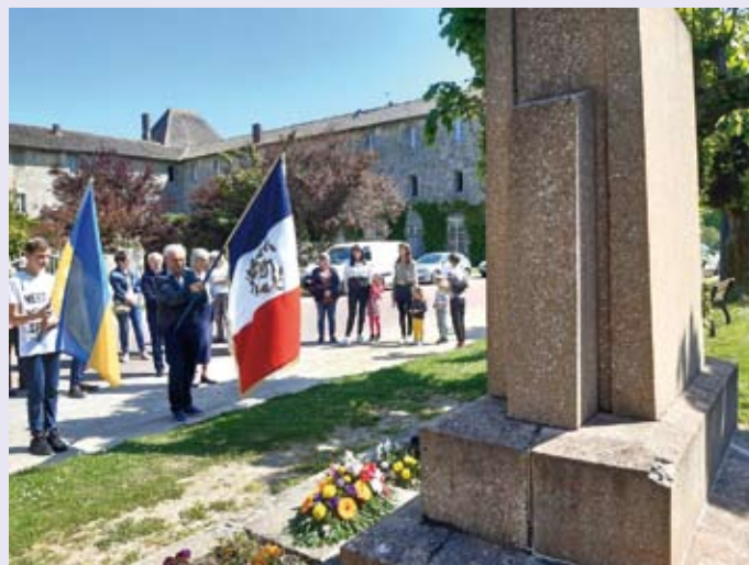
Commémoration du 8 mai 1945

Malgré le danger, les bombes et les assauts répétés des troupes russes, elles ont décidé de regagner leur pays, mues par ce besoin indicible de fouler de nouveau leur terre natale, de retrouver les êtres qu'elles chérissent et de participer à l'effort de guerre.