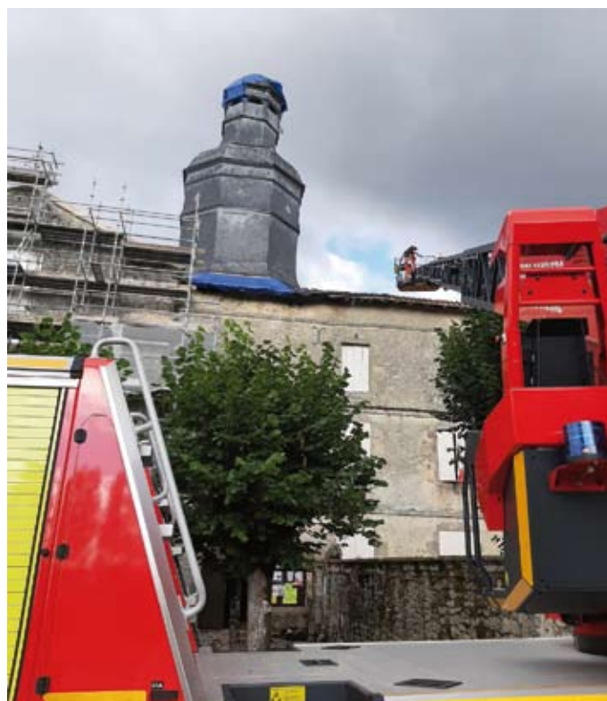
Le bâchage du clocher

Après celui de l'église, c'est désormais un nouveau marché public que la collectivité doit lancer pour assurer la reconstruction du clocher, la réfection de la toiture de la Mairie et la réparation des cloches. La commune a signé une convention avec les services de la DRAC (Direction Régionale des Affaires Culturelles - Conservation Régionale des Monuments Historiques) qui vont se charger, à titre gracieux, de l'assistance à la maîtrise d'ouvrage pour la durée du chantier.