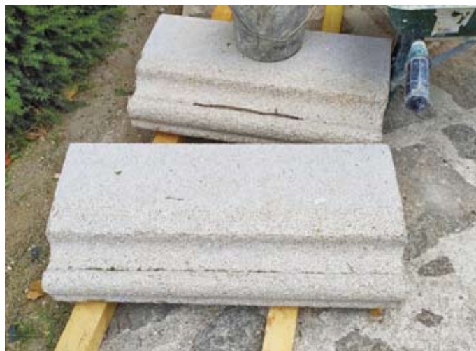
Taille d'éléments de la corniche (2 avril 2022)