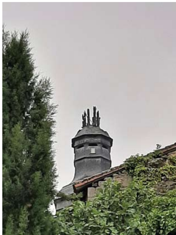
L'incendie est maîtrisé