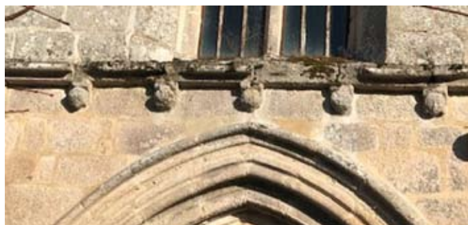
Corniche et modillons avant la restauration