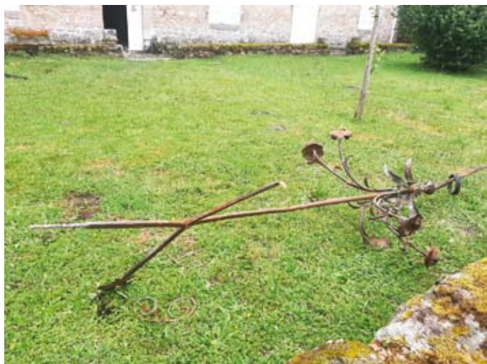
Les restes de la flèche foudroyée