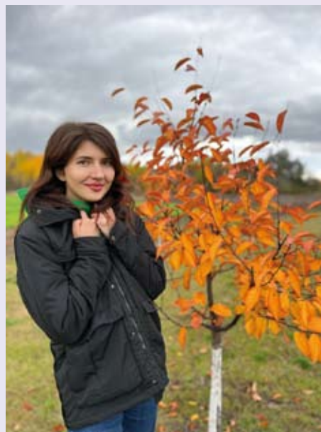
Troïts'ke - automne 2022

Elle semble bien loin notre vie paisible à Mortemart. Cette parenthèse française nous a cependant donné la force de faire face avec détermination, de ne jamais baisser les bras, de rester confiants en souhaitant que le conflit trouve une issue rapide, que l'Ukraine retrouve la paix et que nous puissions revenir à Mortemart pour remercier ceux qui nous ont tant donné. »