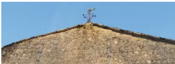
Haut du fronton avant la restauration