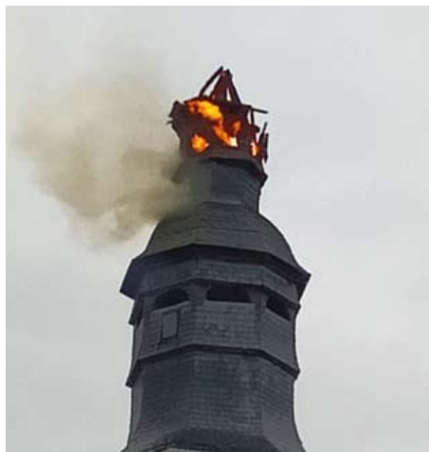
En quelques minutes