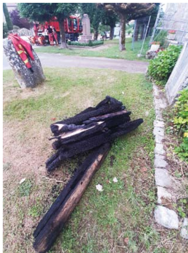
Quelques poutres calcinées