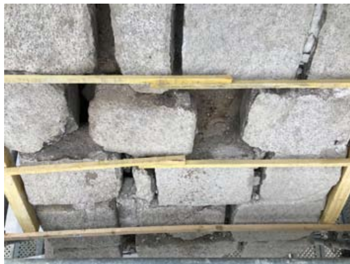
11 mars 2022