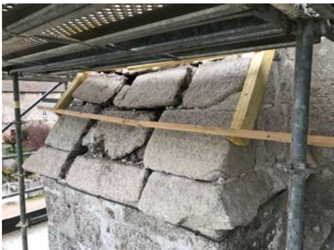
11 mars 2022

Parallèlement, après avoir été dégagé, le contrefort gauche de la façade principale a révélé une béance préoccupante. Un diagnostic attentif a confirmé l'affaissement intérieur des matériaux de remplissage, vraisemblablement dû aux infiltrations d'eau au fil des siècles. Après avoir déposé un certain nombre de pierres de taille, il a fallu combler ce pilier pour le consolider.