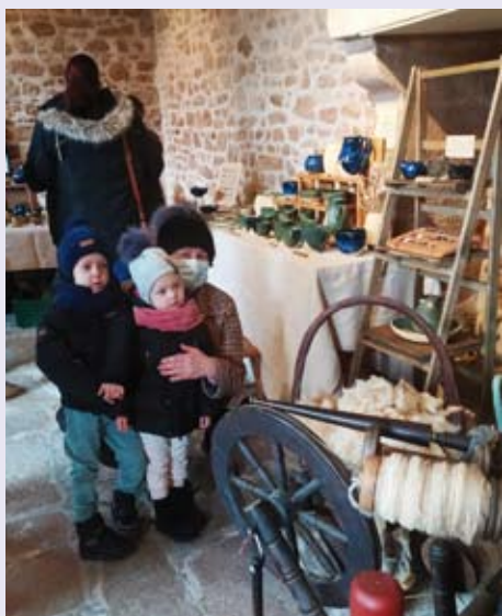
Journées Européennes des Métiers d'Art - avril 2022

Puis, répondant à l'appel d'un groupe de bénévoles locaux ayant des liens familiaux avec l'Ukraine ou y ayant fait leur vie, et qui cherchaient des hébergements pour les familles ukrainiennes (essentiellement femmes et enfants) qui avaient fui la guerre, le Conseil Municipal a voté la mise à disposition de deux logements communaux vacants qui ont été, là encore, entièrement équipés par les dons ou prêts des particuliers, non seulement de Mortemart mais aussi des communes voisines. Une équipe de bonne volonté s'est spontanément créée, renforcée par des contributions extérieures et, dans une ambiance fort sympathique, les appartements ont pu être mis à disposition dans un temps record. Soulignons la participation de la commune de Gajoubert qui, ne disposant pas de logement disponible, nous a soutenus en finançant l'achat de fioul domestique pour la chaudière de l'appartement de la place Royale et fourni un grand réfrigérateur-congélateur pour ce même logement.