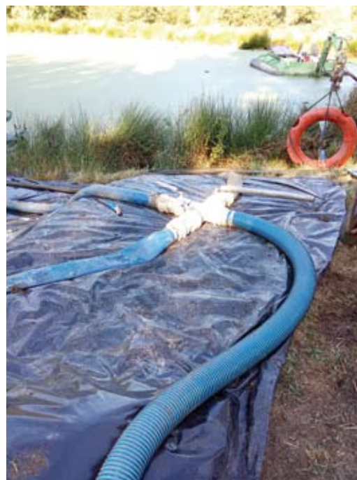
Pompage des boues

Les résultats de ces analyses ont révélé que le taux de remplissage de la lagune (37 %) était supérieur aux 30 % au-delà desquels il convient d'effectuer un curage et que la teneur des boues en cuivre était supérieure à la valeur de référence.