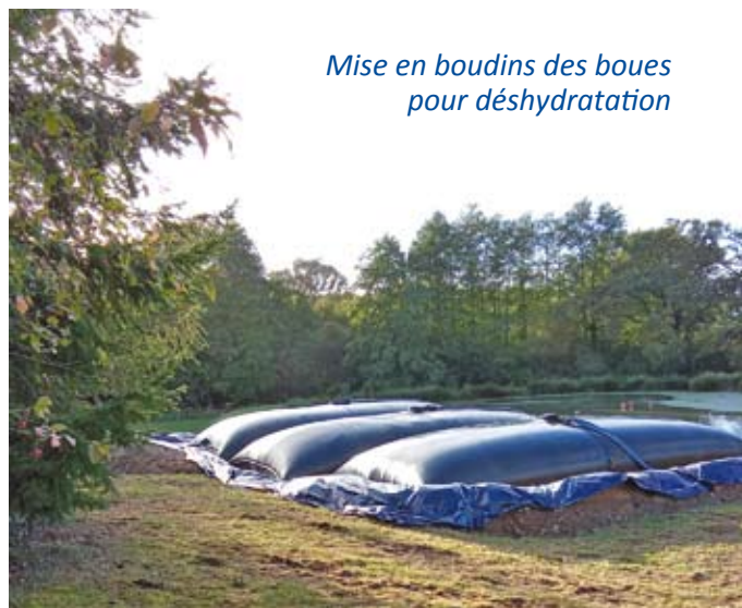
Mise en boudins des boues pour déshydratation

Le curage de 554 m 3 de boues et la mise en place de leur processus de déshydratation ont été réalisés en octobre 2023 par Valbé (Saur).