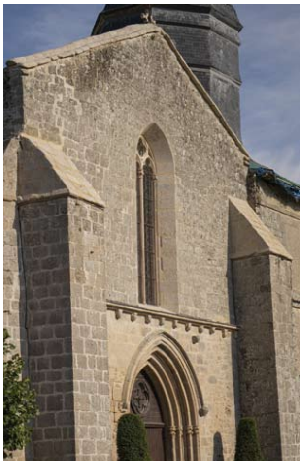
Restauration des pierres de taille