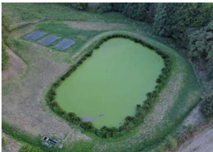
La lagune et les trois filtres à sable

Sur la recommandation du SATESE (Service d'Assistance Technique à l'Exploitation des Stations d'Épuration), les premières phases d'entretien du système d'assainissement ont été entreprises en 2022. Elles ont consisté, d'une part, à curer le réseau des trois filtres à sable et les réseaux annexes (phase confiée à Eco-Vidange), et, d'autre part, à procéder au relevé bathymétrique et à la caractérisation des boues de la lagune (phase confiée à Valbé (Saur)).