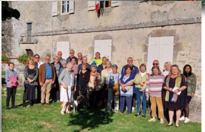
Hommage à l'enseignant Dominique Bernard (16 octobre)