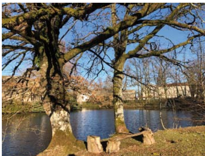
Sentier des douves

- Médiathèque René Rougerie de Nouic - 1, place du Docteur Justin Labuze, ouverte le vendredi de 16h30 à 18h30, le samedi de 10h à 12h.