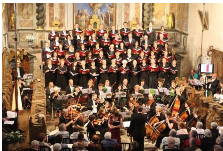
Ensemble Josquin des Prés de Poitiers en concert dans l'église

a exprimé sa profonde gratitude à l'association pour sa générosité et a d'ores et déjà inscrit ce futur chantier à son programme.