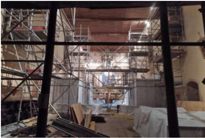
Vues insolites de l'église (mars)