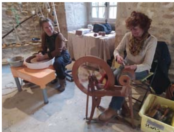
Céramique et filature

« J'ai créé « Ma petite laine » en 2009. Mon entreprise est axée sur la manipulation de la laine d'une manière authentique usant un mélange de techniques traditionnelles et de méthodes plus modernes. D'autres fibres que celles du mouton peuvent être filées, le poil d'alpaga, le poil de lama et même le poil de chien! De plus, une vaste sélection de produits sont créés à partir de ce fil. La nature du produit brut permet l'unicité de chaque pièce dans sa texture et son coloris. Je suis ravie de partager mon savoir-faire artisanal. Ma petite laine propose des stages de filage.»