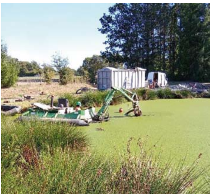
Curage de la lagune